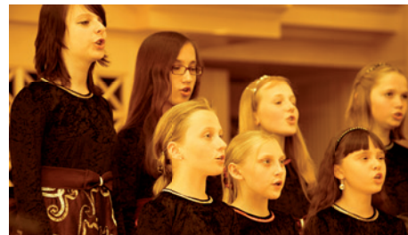
Pražští Andělé (Prague Angels)